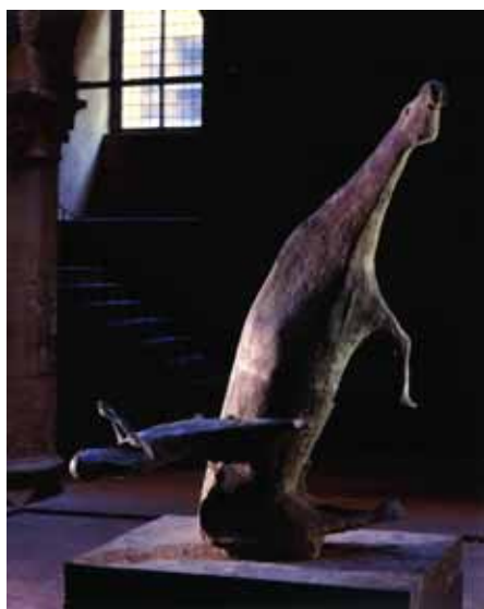
Miracolo , bronzo, 1953 Palazzo Comunale, cortile

I severi spazi conventuali conservano anche alcune sculture in bronzo come il monumentale Miracolo del 1953, la Giovinetta del 1938, le tre Pomone del 1943, il Cavallo del 1945 e la prima versione in argento del pregevole ritratto di Igor Stravinskij del 1950. Il Museo Marino Marini si lega idealmente con l'omonimo museo fiorentino, che espone l'opera scultorea dell'artista, inaugurato nel 1988, pochi anni dopo la morte dell'artista (1980).