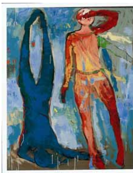
Marino Marini, Giochi nello Spazio , 1966