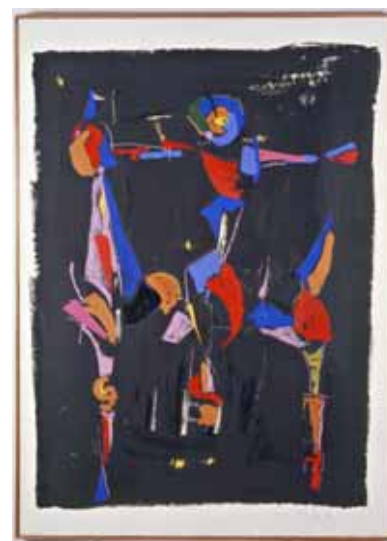
Marino Marini, Bunter Reiter , 1975