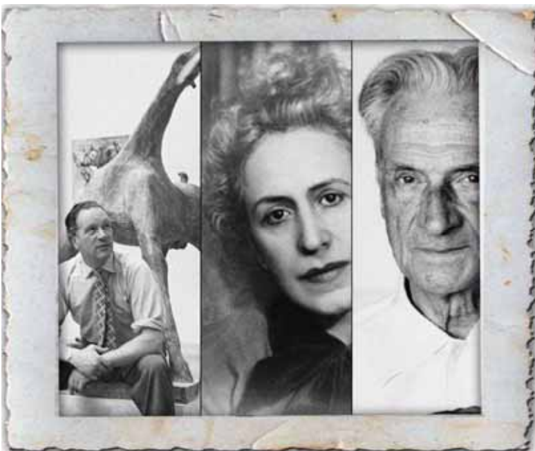
Foto-Cartolina con, da sinistra verso destra, Marino Marini, Gianna Manzini e Giovanni Michelucci.

1985: Come possono brufoli, Mentadent, Raffaella Carrà e Madonna raccontarci ed omaggiare la storia di Pistoia? La risposta è semplice: un laboratorio teatrale su Marini, Michelucci e Manzini, sette alunni strampalati ed un Prof. molto paziente, sapranno guidarci con una buona dose di comicità ad esplorare tre dei più importanti artisti della nostra città....come direbbe il Prof. "Questo è un buon punto di partenza"!